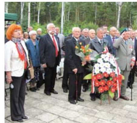
Złożenie wieńców