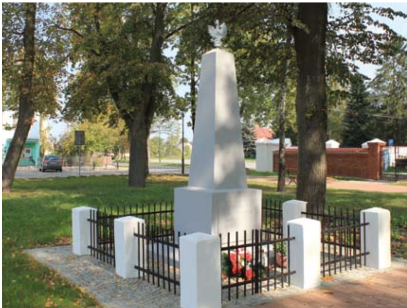
Pomnik po renowacji