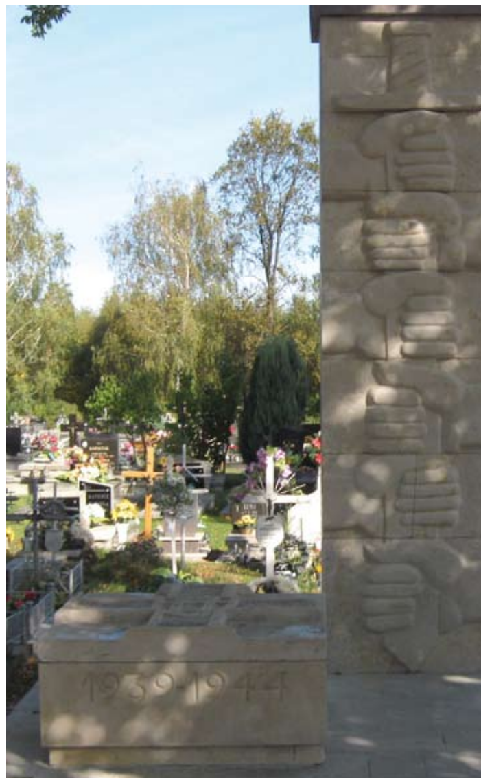
Pomnik po renowacji

z dwoma mieczami w środku tarczy przypomina Krzyż Grunwaldu i stanowi jak gdyby odznaczenie orderowe dla poległych. Na przedniej ścianie tej bryły wyryty jest napis upamiętniający lata tragicznych wydarzeń.