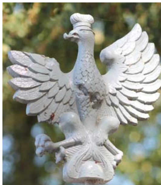
Orzeł na szczycie po renowacji