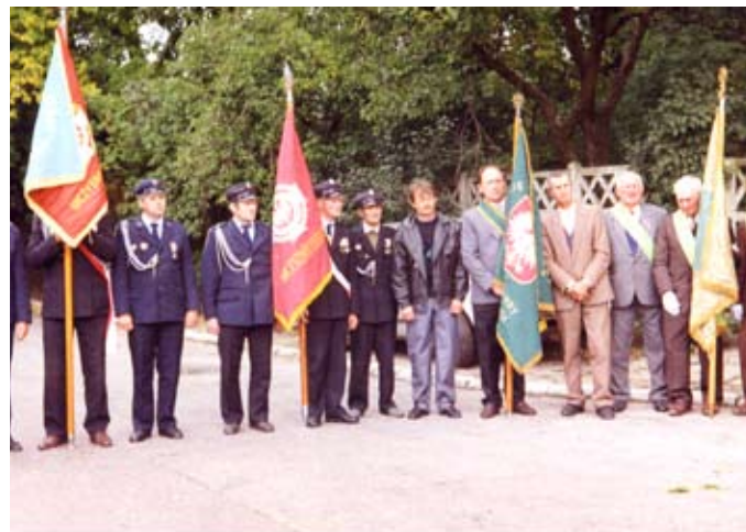
Poczty sztandarowe uczestniczące w 50 Roczniczy Wielkiej Akcji Wysadzenia Pociągu Amunicyjnego