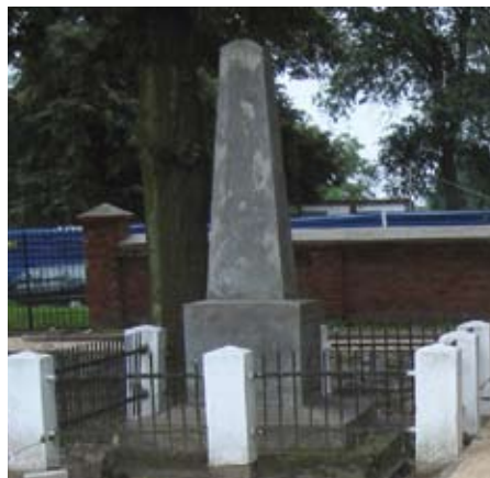
Wygląd pomnika przed jego renowacją