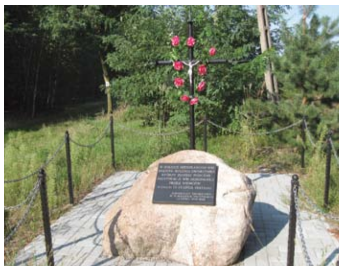
Trzeci pomnik na Dworzysku