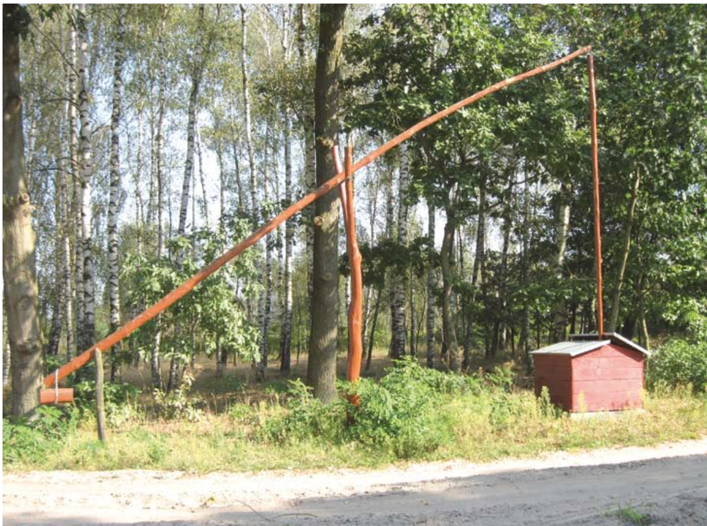
Obecny wygląd studni

nad ranem. Wybrali drugi, ten bróg dał im szansę przeżycia, gdyż niemieckim zbrodniarzom nie chciało się już go penetrować.