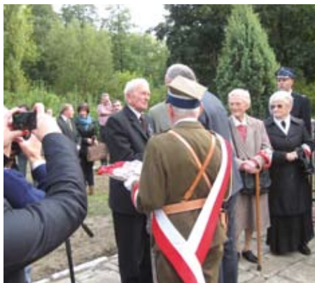
Odznaczenia