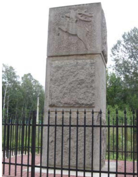
Wygląd pomnika z boku

Las śpiewa do tej pory o tych, co Nieustraszeni... Drzewa oddają honory tym, co walczyli spod cieni.