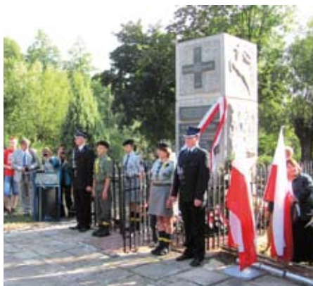
Warta przed pomnikiem