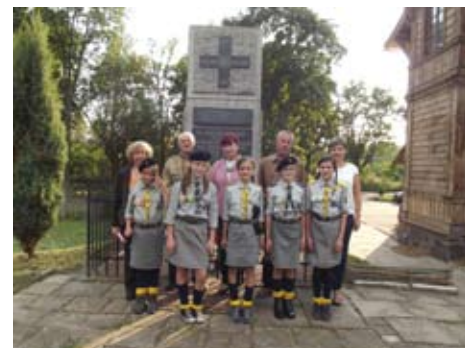
Pamięć o 71 Rocznicy Wysadzenia Pociągu Amunicyjnego