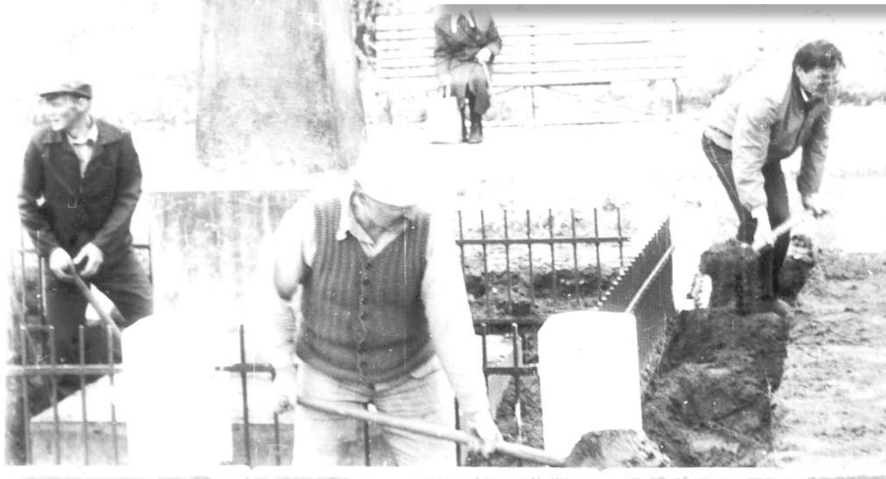
29 kwietnia 1989 r. – Prace nad podniesieniem pomnika