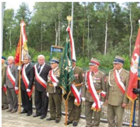
Pocztę sztandarową