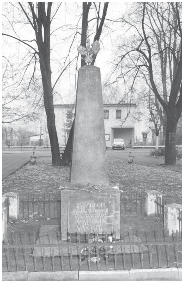
Wygląd pomnika w 1988 r.

Teraz już dobre dni nastały dla odnowionego gołębskiego pomnika, bowiem od 1989 roku ustawą sejmową przywrócono Święto Niepodległości obchodzone 11 listopada pod nową nazwą Narodowe Święto Niepodległości i od tego czasu można już było stale oddawać hołd tym, co wywalczyli nam wolność i niepodległość.