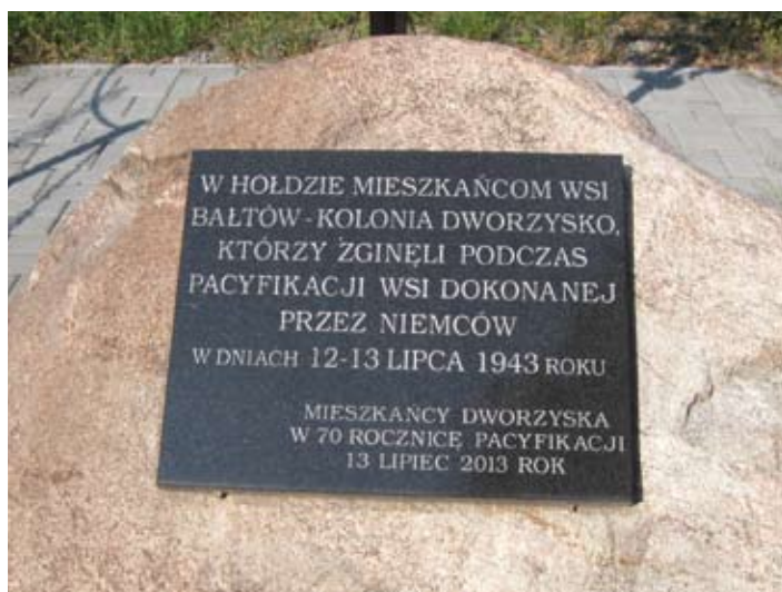
Pamięć mieszkańców o miejscu zbiorowej mogiły przy studni na Dworzysku

Wieść o pożarze dotarła do Osin i Żyrzyna. Na pomoc w ugaszeniu pożaru ruszyła tamtejsza straż, jednakże Niemcy cofnęli strażę i nie dopuścili ich do ognia. Około czwartej rano na pomoc pośpieszył również gajowy Rogala, lecz i jego zauważyli napastnicy niemieccy, którzy puścili w jego kierunku serię strzałów. Ranny gajowy