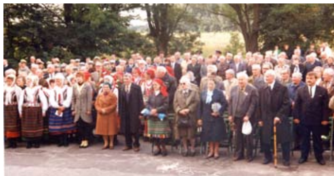
Koło Gospodyń Wiejskich z Gołębia, kombatanci oraz mieszkańcy Gołębia biorący udział w uroczystości upamiętniającej partyzancką akcję