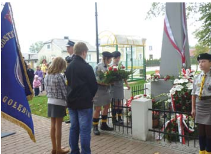
Uczczenie Narodowego Święta Niepodległości