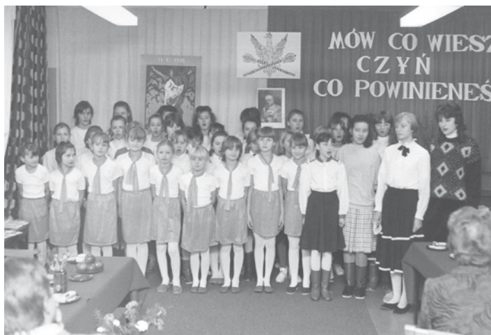
13 listopada 1988 r. - uczczenie Święta Niepodległości przez TPG oraz mieszkańców Gołębia

nowy ustrój niewskazane było afiszowanie swoich poglądów politycznych, a tym bardziej czczenie miejsca pamięci, jakim był pomnik z orłem w koronie.