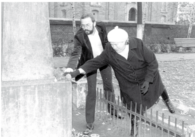
Złożenie kwiatów pod pomnikiem – 13 listopada 1988 r.

w montażu poetycko-muzycznym Mów, co wiesz i czyść, co powinienes przekazali wszystkim przybyłym na sesję, że pamięć i wierność Ojczyźnie jest również wyrazem pięknego patriotyzmu.