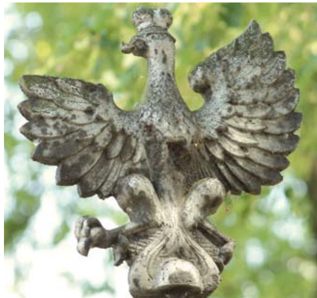
Ślady zniszczeń na orle

Czasy powojenne również nie służyły aktom pamięci o pomniku, bowiem w 1945 ustanowiono Narodowe Święto Odrodzenia Polski, obchodzone 22 lipca, w rocznicę ogłoszenia Manifestu PKWN, i jednocześnie zniesiono Święto Niepodległości. Mieszkańcy Gołębia jedynie w sercach swych składali hołd poległym w walkach o niepodległość i całość granic Ojczyzny. Z uwagi na