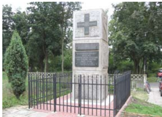
Pomnik od frontu