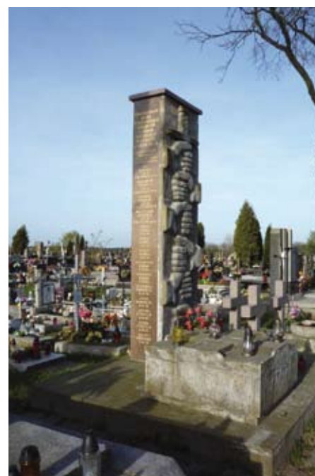
Wygląd pomnika przed jego renowacją