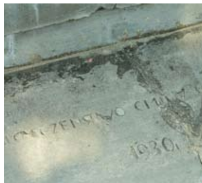
Zniszczenia napisów pod wpływem czasu i warunków atmosferycznych