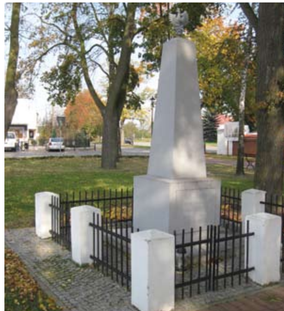
Odnowiony pomnik w szacie wiosennej i jesiennej